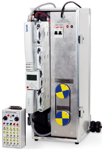
Nos valises Variateurs 9400 simple et double