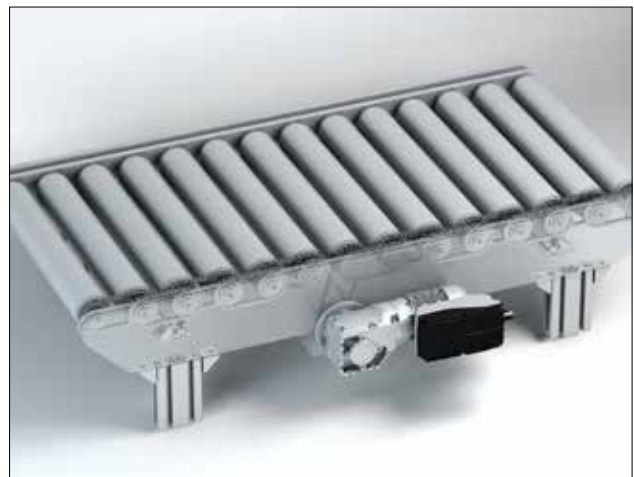
Beispiel: Roller Conveyor Outline